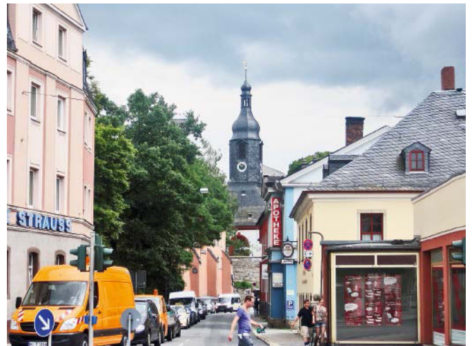
Abb. 2: Kirche in der Stadt: St. Lorenz-Kirche in Hof/Oberfranken

Als wichtige Vermittler zwischen Kirchengemeinden oder örtlichen Verbandsstrukturen und der Landesebene bis hin zur Bundesebene haben sich die Vertreter der jeweiligen „mittleren“ Handlungsebene in den Landeskirchen bzw. -verbänden, Seelsorgeämtern der (Erz-)Diözesen, Diözesan-/Landescaritasverbänden sowie den Fachverbänden herausgestellt. Gegenüber den meist nach Fachressorts und Zielgruppen organisierten Verwaltungsstrukturen ist hier der Querschnittsansatz eines zielgruppen- und handlungsfeldübergreifenden Handelns mit einem sozialräumlichen Bezug stärker zu verankern.